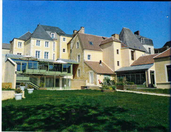
Côté parc, de beaux appartements d'hôtes avec spa à 15 minutes du golf. Une suite avec poutres et torchis (ci-dessous).

Il doit être réaménagé au cours de l'hiver 2011-2012. Seu de 30 balles: 2 €.